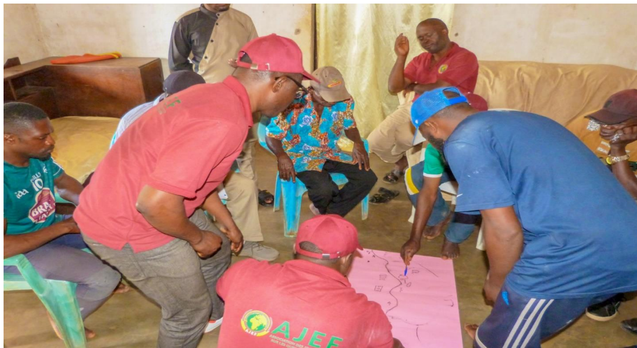
Photo 5. Élaboration concertée de la carte participative