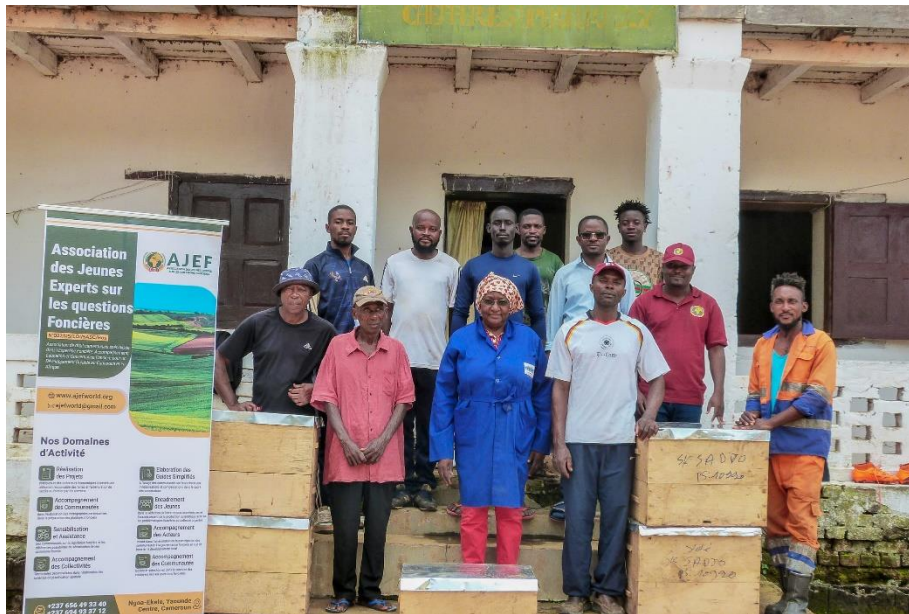
Photo 11. Réception des ruches à la Chefferie de 2 ème Degré d'Edouma

Cette phase non prévue au départ a été rendue nécessaire et urgente en raison des difficultés logistiques, rencontrées lors de la préparation de cette mission. En effet, les ruches à utiliser pour la circonstance, au village Edouma, ont été commandées et fabriquées en avance à Ngaoundéré. Confiée à une agence spécialisée dans le transport de colis, pour leur transbordement jusqu'à Yaoundé, pour des raisons que nous ignorons, celles-ci n'ont malheureusement pas pu rejoindre cette destination intermédiaire à temps, ENCORE MOINS Akonolinga, dans le temps imparti à la mission. Il aura fallu, plusieurs interventions au niveau de Ngaoundéré, pour voir enfin l'agence de transport de colis commis à cet effet, s'exécuter et convoier les colis le 16 octobre 2024 , alors que toute l'équipe, fatiguée d'attendre sur place et aux vues des implications financières de ce laxisme, avait décidé à contrecœur, de remonter sur Yaoundé.