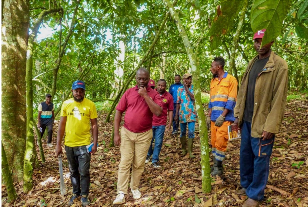
Photo 7. Aperçu d'une partie de l'équipe de mission sur le terrain lors du transect