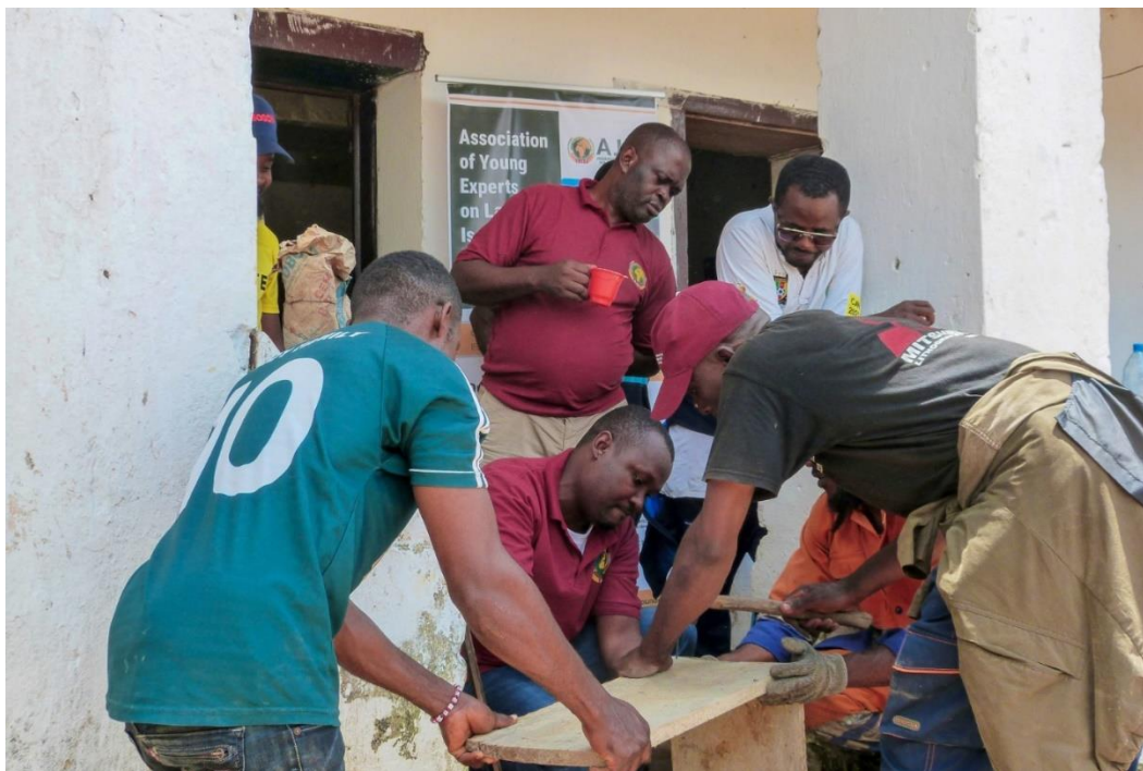
Photo 10. La fabrication des ruches

La formation pratique sur la fabrication des ruches traditionnelles a clôturé cette journée marathon ; avec les participants, il a été question avec du matériel de récupération collecté sur place, de fabriquer un prototype séance tenante, respectant autant que possible, les mensurations standards. Ce transfert de technologie hautement apprécié servira de base à la pérennisation de cette activité dans le village et environ, en même temps qu'il deviendra un poste d'emploi permanent pour le principal bénéficiaire.