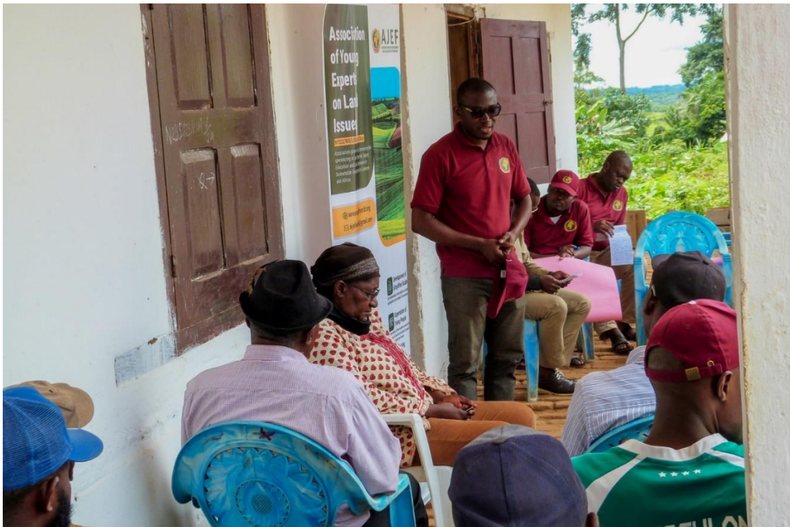
Photo 2. L'Allocation d'ouverture de M. le Président de l'AJEF